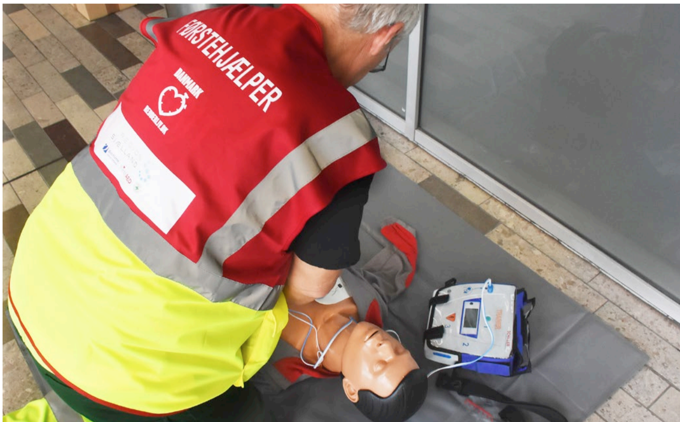
Hjertestartere bliver nu også etableret på Lolland Kommunes plejecentre.

Nu kommer der hjertestartere på plejecentre